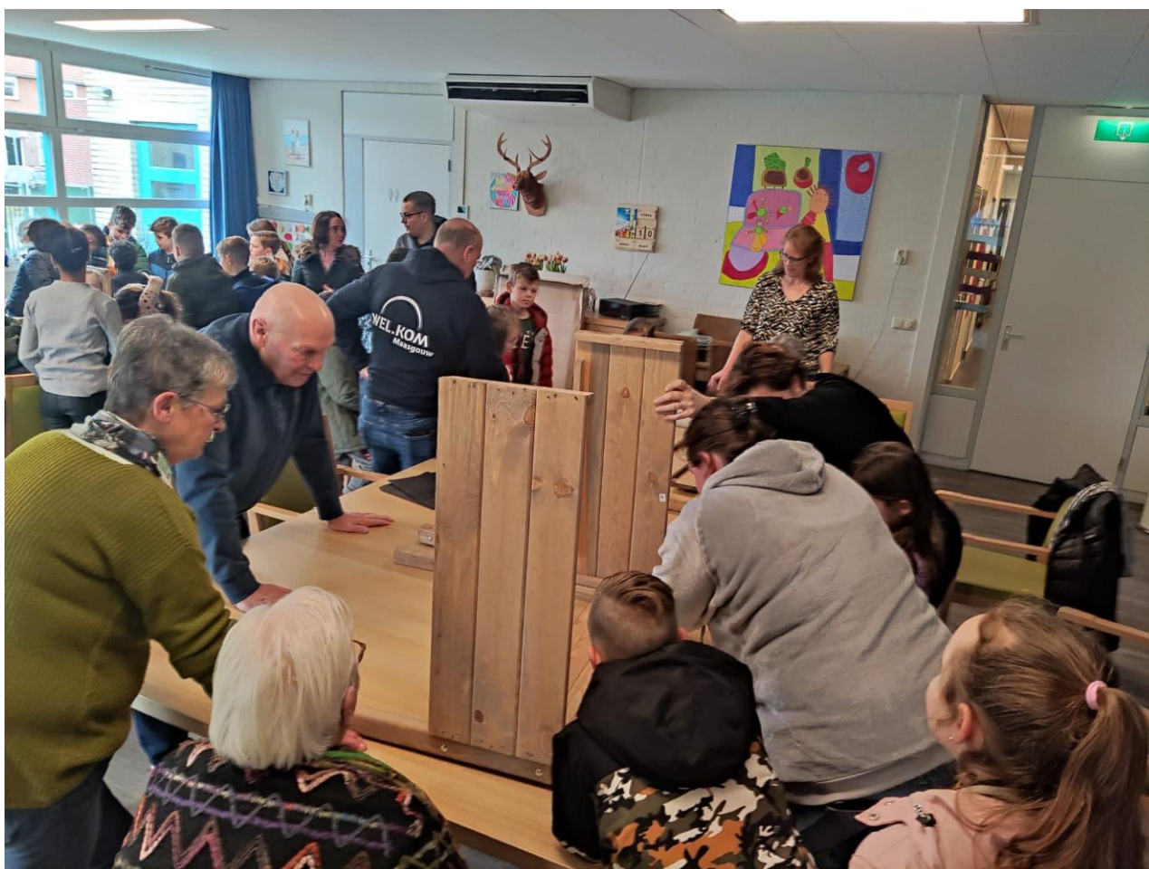
Verbinding tussen jong en oud bij het NLdoet project van 2023.

Het opbouwwerk heeft flink geïnvesteerd in het leren kennen van en (h)erkend worden door zowel de netwerkpartners als de inwoners in de diverse dorpskernen. In 2024 investeren we in personele uitbreiding en in een nog betere samenwerking met netwerkpartners. We doen het tenslotte samen voor de inwoners! Opbouwwerk gedijt langzaam en dient meer verankerd te worden in de Maasgouwse samenleving. Het doel is om de sociale basis in de gemeente Maasgouw te versterken. Hiervoor is een extra impuls en een betere positionering van het opbouwwerk noodzakelijk.